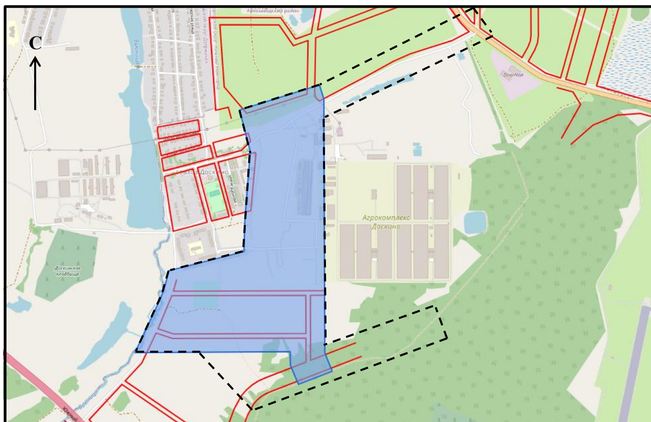
Схема границ подготовки проекта планировки территории (арх. № 78/24)

«ПРИЛОЖЕНИЕ к приказу министерства градостроительной деятельности и развития агломераций Нижегородской области от 17 мая 2024 г. № 06-01-02/31